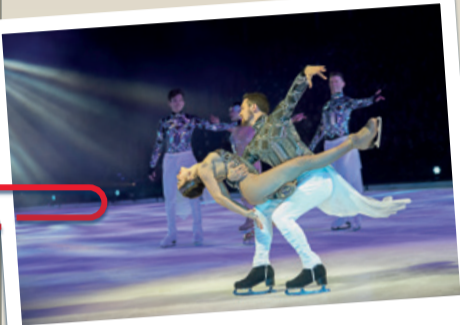
Holiday on Ice

S. 02 Holiday on Ice feiert 75. Geburtstag