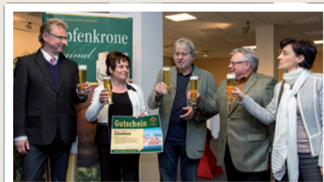
Übergabe des kultCARD-Jahreshauptpreises 2014