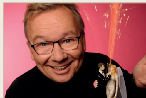
Jogis Eleven „Neue Welt“