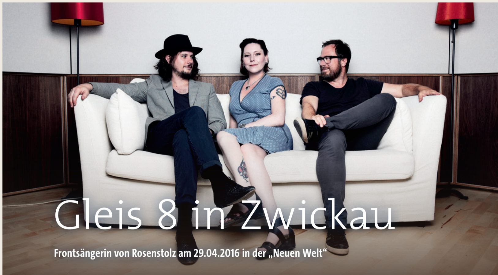
Frontsängerin von Rosenstolz am 29.04.2016 in der „Neuen Welt“