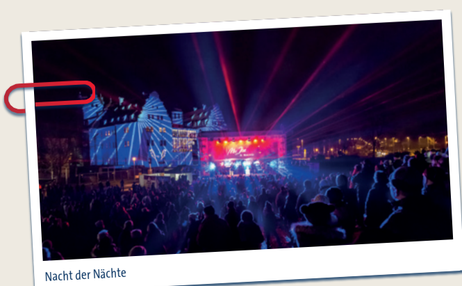
Nacht der Nächte

Lassen Sie sich überraschen und freuen Sie sich auf einen unterhaltsamen Abend mit den drei Rettern der Tafelrunde!